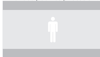
ÉTENDU (2048 X 858)

Tous les fichiers doivent contenir : Tous les fichiers doivent contenir : 10 images claquettes, 10 images noires, un «2-bip» visible (une image d'une fréquence de 1 kHz placée 2 secondes avant la première image du contenu), suivies de 47 images noires, suivies de la première image de la vidéo ( voir ci-dessous ).