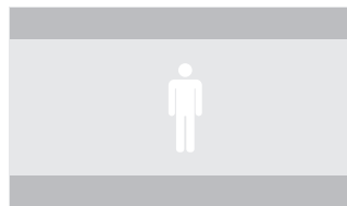
ÉTENDU (2048 X 858)

Tous les fichiers doivent contenir : Tous les fichiers doivent contenir : 10 images claquettes, 10 images noires, un «2-bip» visible (une image d'une fréquence de 1 kHz placée 2 secondes avant la première image du contenu), suivies de 47 images noires, suivies de la première image de la vidéo ( voir ci-dessous ).