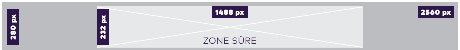
UPER BANNIÈRE – ORDINATEUR | TABLETTE