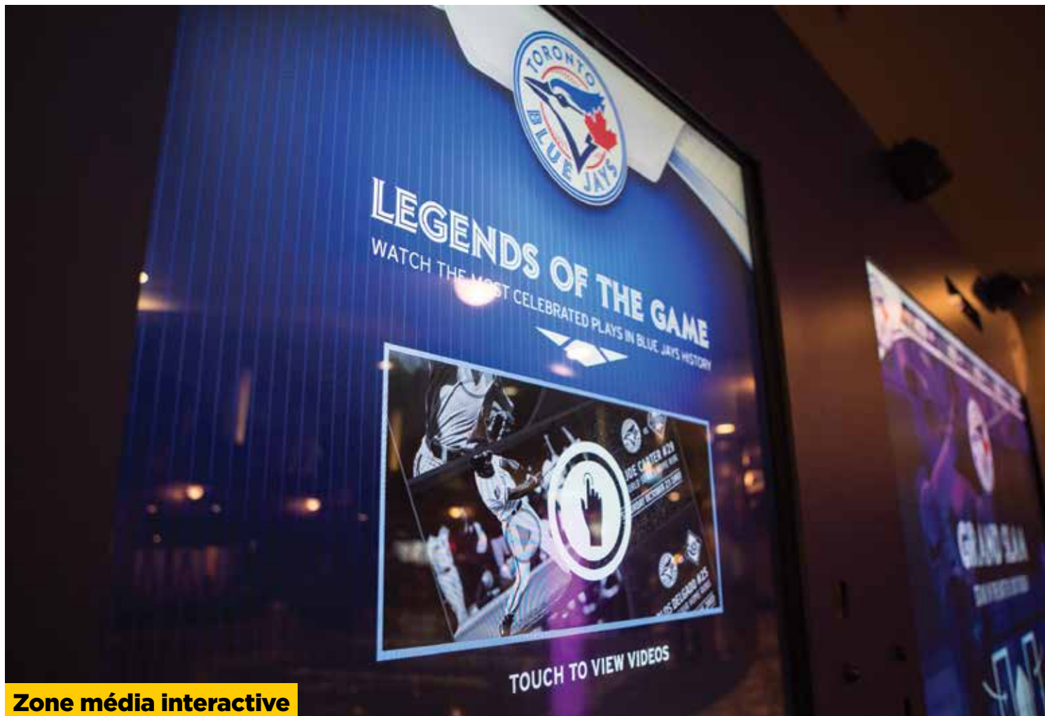
Zone média interactive